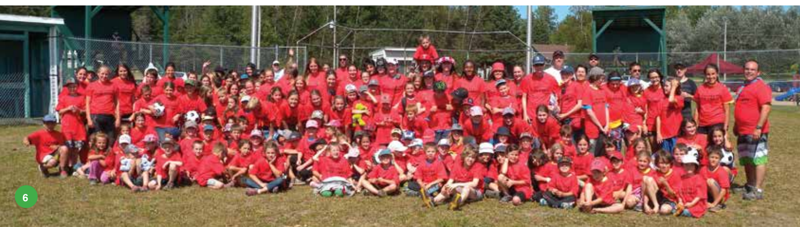
Camp de jour Été 2015

Grâce au soutien de Québec en forme et d'Autray en forme, nous avons pu, pour une deuxième année consécutive, embaucher un entraîneur afin de donner un entraînement en plein air. Ce projet a pris fin le 31 août dernier. Vous pouvez demander à votre service des loisirs le dépliant comprenant tous les exercices qui ont été vérifiés par un kinésiologue.