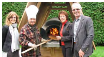
Four à pain de La Visitation-de-l'Île-Dupas, projet de l'appel du printemps 2014.

Comme à l'accoutumée, dès l'amorce du printemps, la Municipalité régionale de comté (MRC) de D'Autray fait appel à la créativité des citoyens et organismes du milieu afin de recevoir des propositions de projets favorisant le rayonnement de sa culture, de son patrimoine et de son histoire sur son territoire.