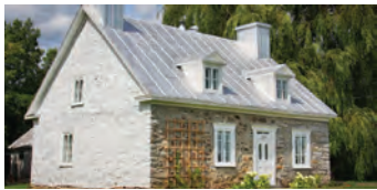
Architecture d'inspiration française (Sainte-Élisabeth)