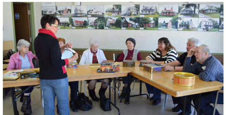
© Sébastien Proulx | Le projet Transmission à La Visitation-de-l'Île-Dupas

Toujours selon l'animatrice, les discussions sont variées et animées, car les personnes partagent des souvenirs communs qui amènent à d'autres souvenirs pour finalement former un tableau coloré. Lors des ateliers, une captation vidéo permet la sauvegarde des échanges sur le patrimoine vécu par les aînés du territoire et enrichit l'histoire des municipalités et de ses familles. Les personnes souhaitant obtenir plus de renseignements sont invitées à joindre madame Blondin par téléphone au 450 836-1550 ou par courriel à l'adresse suivante : blondin.laporte@xplornet.ca .